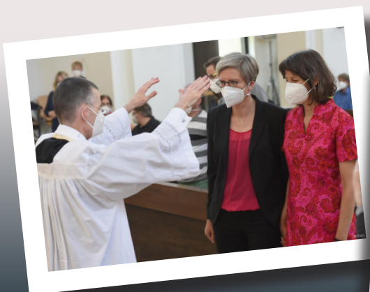
Sacerdote abençoando uma dupla de duas mulheres. Munique

Outra manobra dialética: os ativistas sinodais espalham entre os fiéis o medo de dizer algo contra as inovações, sob