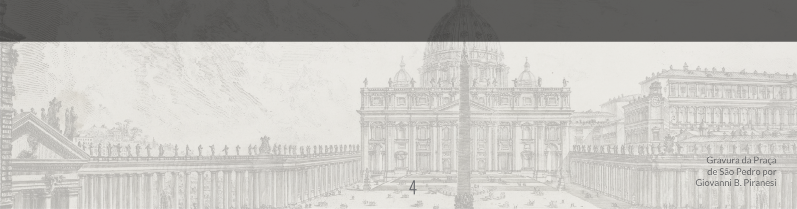
Gravura da Praça de São Pedro por Giovanni B. Piranesi

“A crise ariana soprou como um vendaval, mas a Igreja subsistiu, venceu, floresceu. O arianismo passou... É o que acontecerá após os presentes furacões ‘sinodais’