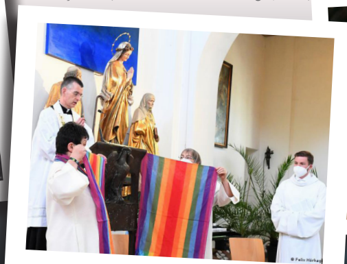
Bandeiras de arco-íris na Igreja de São Bento em Munique, onde duplas do mesmo sexo foram abençoadas.