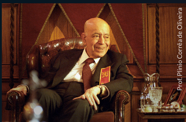
Prof. Plínio Corrêa de Oliveira

autoridade canônica está sendo gradualmente substituída pela ascendência de “profetas” mais ou menos pentecostais, eles próprios congêneres dos feiticeiros do estruturalismo-tribalismo 20 ”