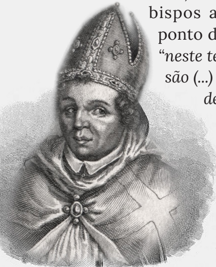
Ário negou a divindade de Jesus Cristo

“A crise ariana soprou como um vendaval, mas a Igreja subsistiu, venceu, floresceu. O arianismo passou... É o que acontecerá após os presentes furacões ‘sinodais’