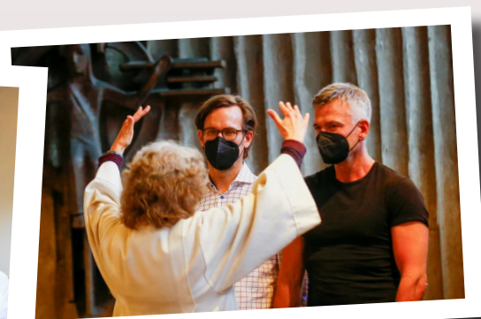
t Uma “agente pastoral” abençoa duplas do mesmo sexo durante uma cerimônia em uma igreja em Colônia, Alemanha. Thilo Schmuelgen/Reuters, 2021