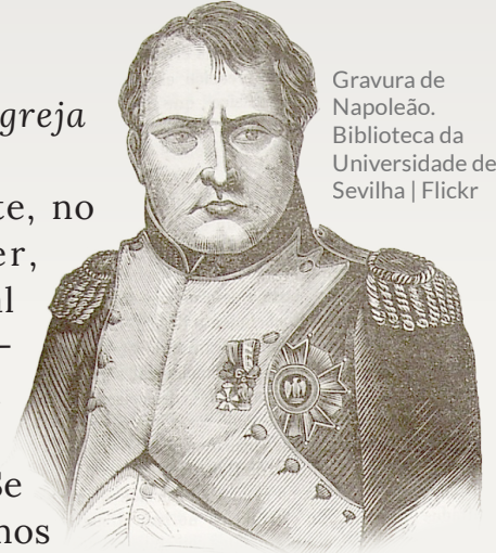
Gravura de Napoleão.

O Cardeal apontava para uma verdade crucial: Nosso Senhor Jesus Cristo nunca permitirá que sua Igreja seja destruída, venham os ataques de dentro ou fora de suas muralhas.