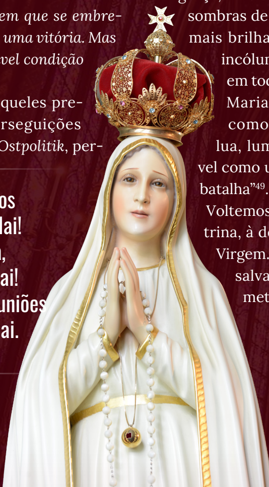
Imagem peregrina internacional de Nossa Senhora de Fátima

Falai, portanto. Oh sim, vos suplicamos ajoelhados, falai! De público, na imprensa, nos boletins católicos, falai! Nos círculos privados, nas reuniões paroquiais, aos amigos, falai.