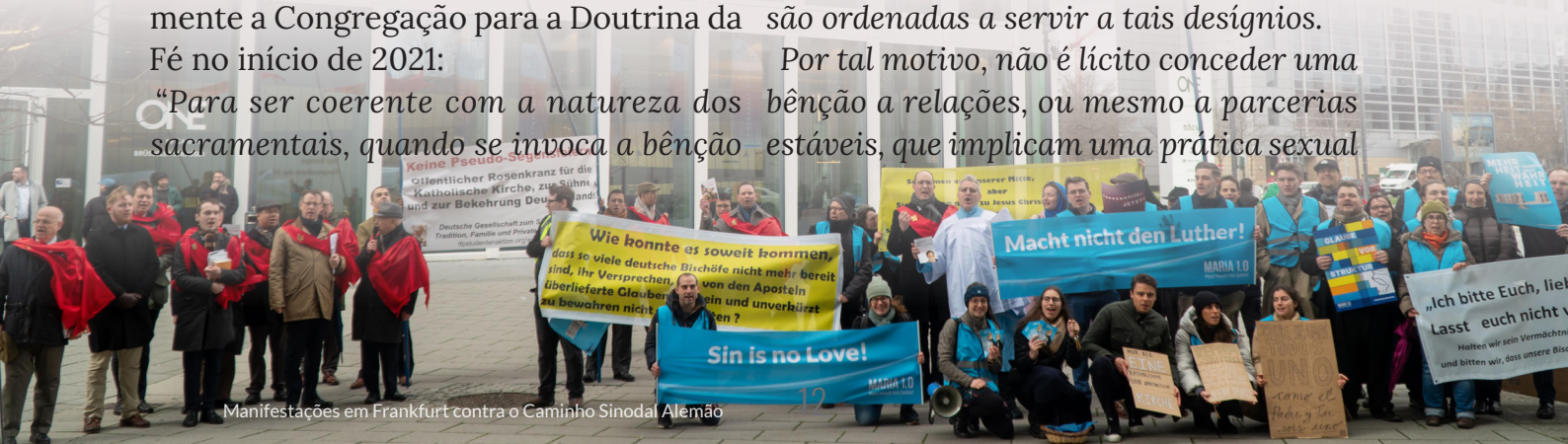
Manifestações em Frankfurt contra o Caminho Sinodal Alemão

Por tal motivo, não é lícito conceder uma bênção a relações, ou mesmo a parcerias estáveis, que implicam uma prática sexual